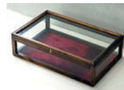
コレクションケース